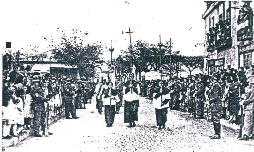
Principio de la Procesión que se organizo desde la Parroquia hasta la Iglesia del Colegio para trasladar las Sagradas Reliquias. Llenaban la carrera fuerses armados.