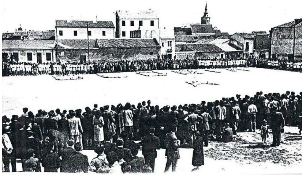
año - 1949 - Plaza

Gloria a Calasanz, forman los alumnos en el amplio solar de la Plaza de toros frente a nuestro colegio de P.P. Escolapios.