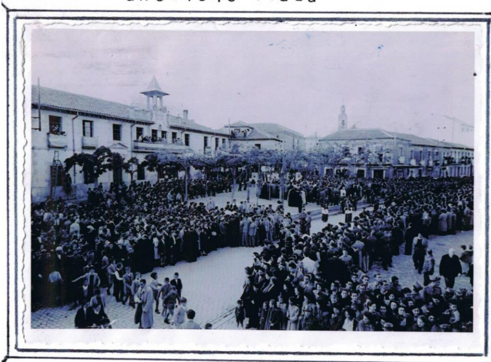
Getafe - ayuntamiento