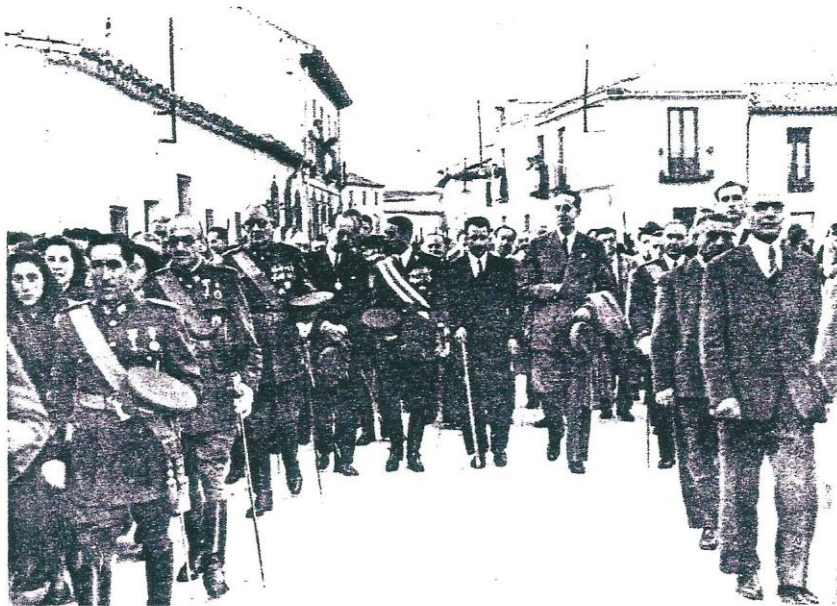
Las Autoridades civiles y militares. cerrando la procesión que se dirigia desde la Parroquia al Colegio